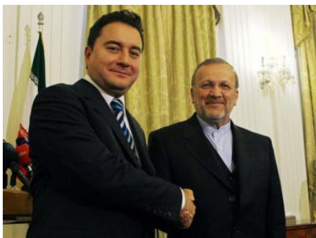
Die Außenminister der Türkei Ali Babacan (li.) und Iran Menutscher Mottaki

http://www.tagesschau.de/ausland/tuerkei24.html